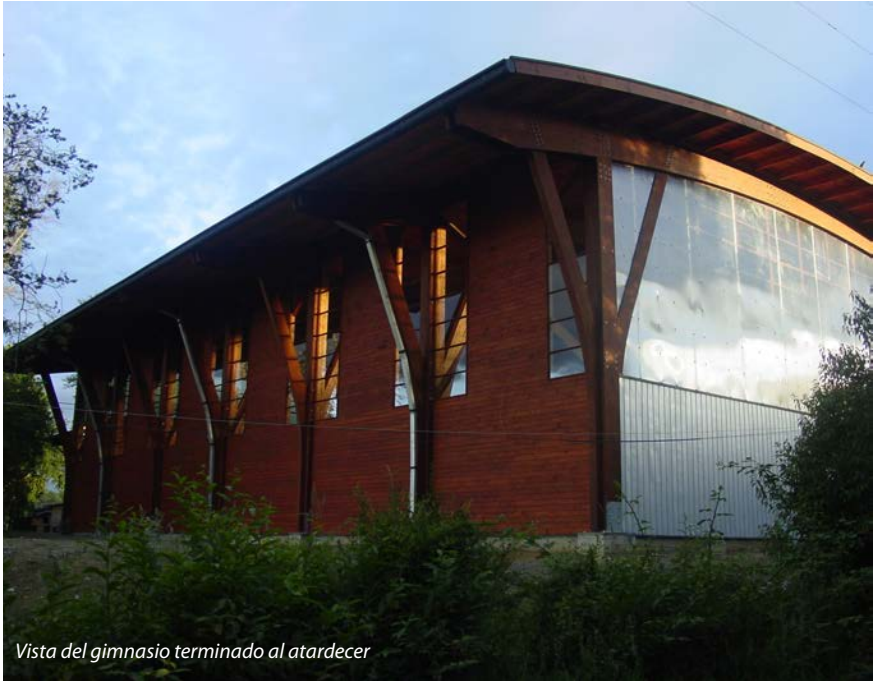
Vista del gimnasio terminado al atardecer