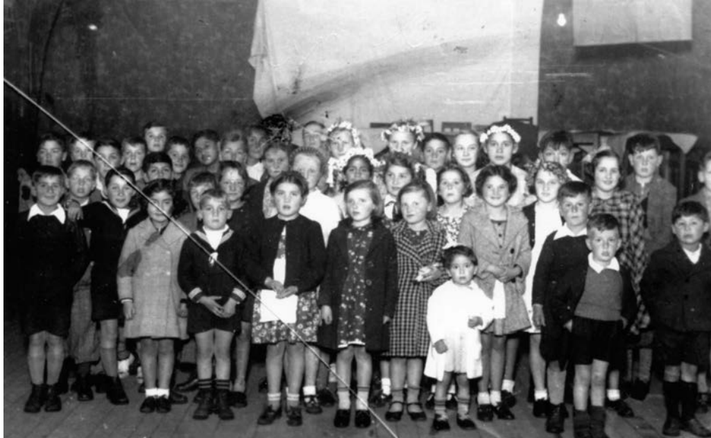
Alumnos del colegio