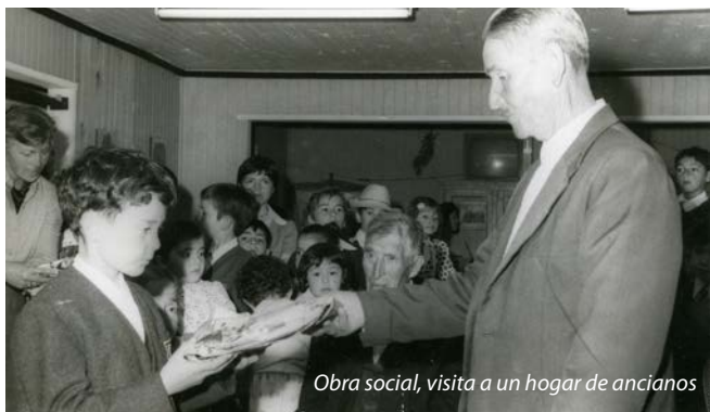
Obra social, visita a un hogar de ancianos

El nivel académico es muy bueno y el Colegio es visitado por un profesor de Temuco para la validación de los exámenes.