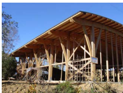
Construcción de techumbre, abril 2003