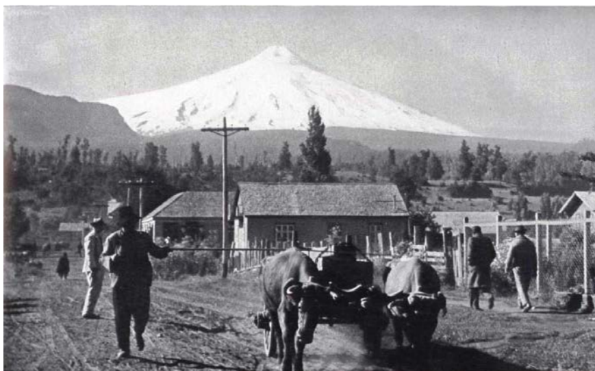
Colegio Alemán de Pucón

A comienzos del Siglo pasado, año 1916, un grupo de visionarios inmigrantes alemanes, se adentran en la zona cordillerana de Pucón, poblado que en ese entonces contaba con una sola calle, una plaza, una iglesia y algunas casas.