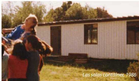
Las salas container, 1986

Debido al gran prestigio adquirido por el Colegio al obtener el Primer Lugar en la Evaluación SIMCE, año 1997, las