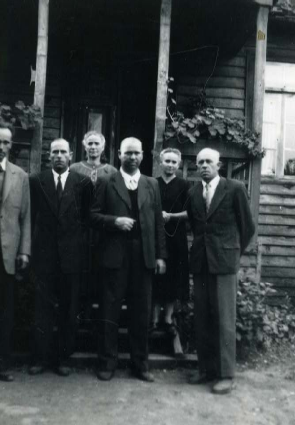
Colonos de Quilaco, miembros del directorio

de un profesor para comenzar una nueva jornada.