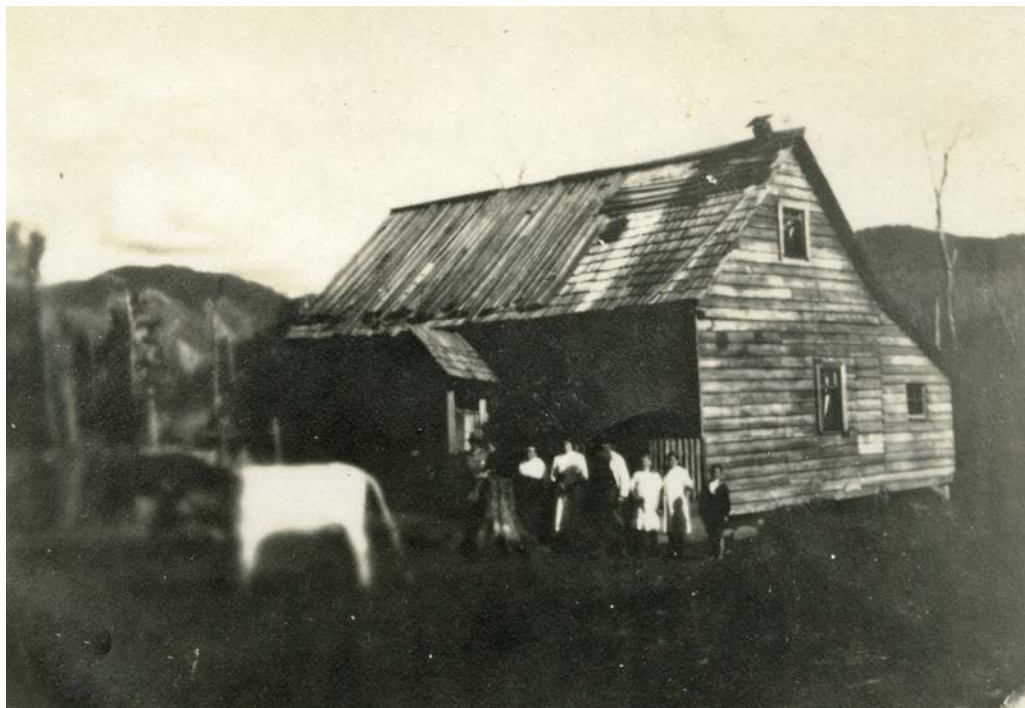
Primer colegio en Quilaco.

Pasaron los primeros años desde su arribo y sintieron la necesidad de tener un lugar para que sus hijos estudiaran,