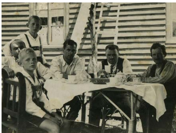
Colonos de Quilaco