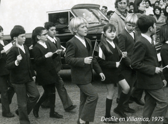
Desfile en Villarrica, 1975