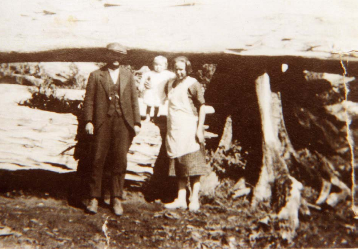
Colonos de la zona