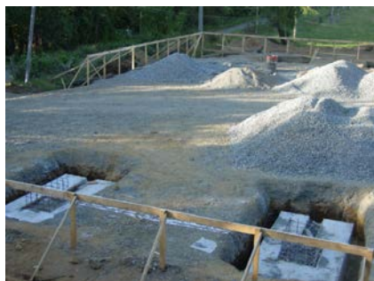
Construcción de cimientos, enero 2003