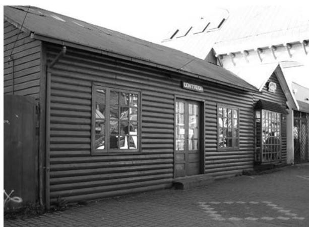
Tercer Colegio, calle O'Higgins (foto actual)