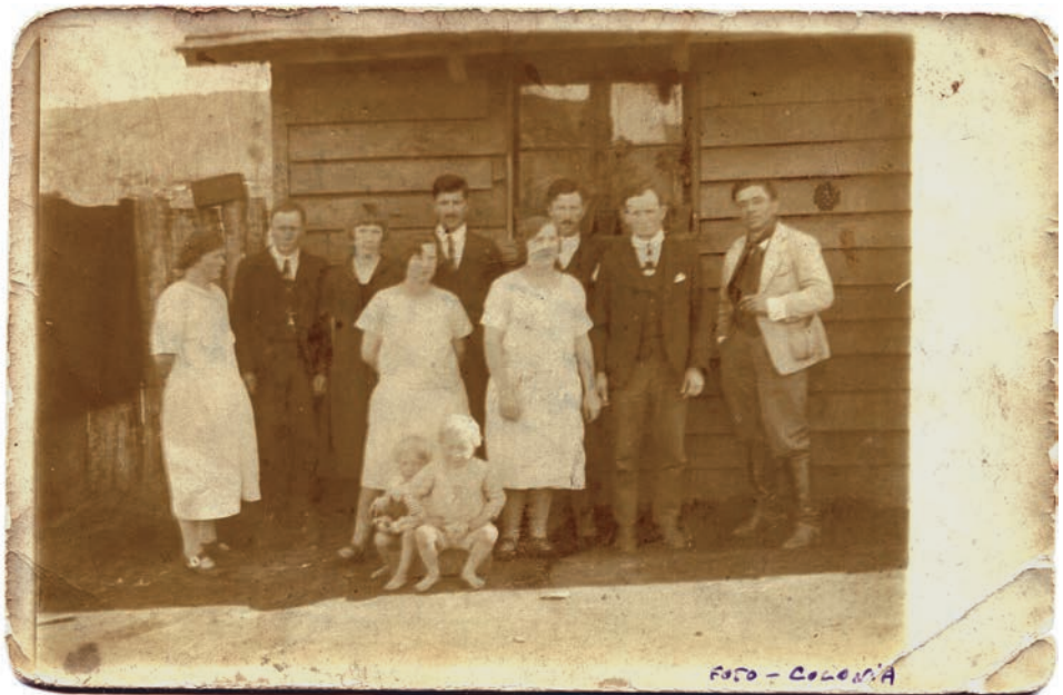
Colonos de Quilaco

Entre los años 1916 y 1924 se desconoce la vida de esta comunidad, ya que no hay antecedentes escritos en los registros porque faltan las hojas de este período en los libros. Sólo en el año 1927 se tiene conocimiento de las actas y se sabe que el terreno del Colegio