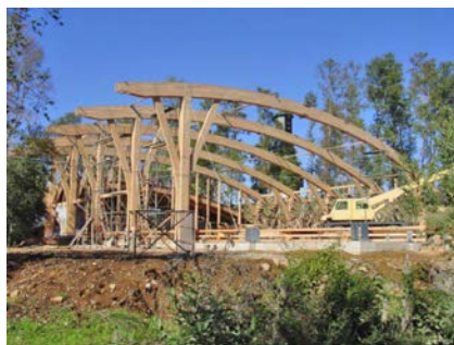
Construcción de estructura, abril 2003