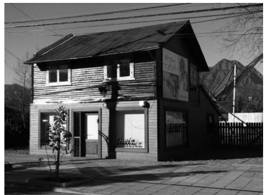
Segundo Colegio, calle O'Higgins (foto actual)

Desde sus comienzos, el establecimiento contó con profesores alemanes en su mayoría y algunos chilenos, que siempre mantuvieron un alto nivel académico, e impartieron la mayoría de las asignaturas en el idioma alemán.