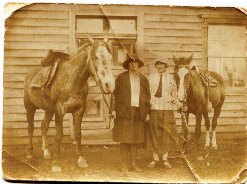
Foto original de alumnas del colegio

Más tarde, en el año 1933, se otorga el título definitivo de dominio del sitio sin número de la Manzana N° 6, entre las calles antes mencionadas.