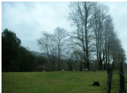
Lugar donde se asentó el colegio en Quilaco