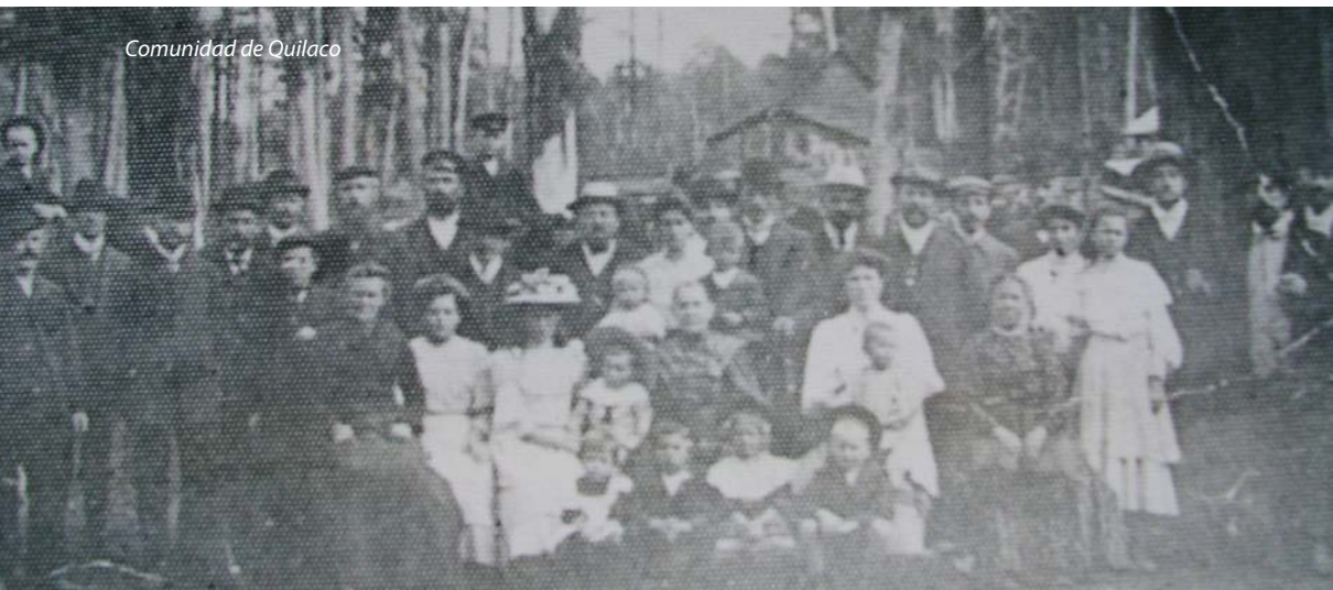
Comunidad de Quilaco

La matrícula había subido en ese entonces a doce alumnos. Los entrevistados de la zona, sostienen que la vida del estudiante de esa época, era muy sacrificada, ya que debían caminar largos trayectos, algunos de ellos sin zapatos, o viajar a caballo, puesto que eran los únicos medios para llegar a la hora indicada al Colegio, donde les esperaba una sala tibia y las cariñosas palabras