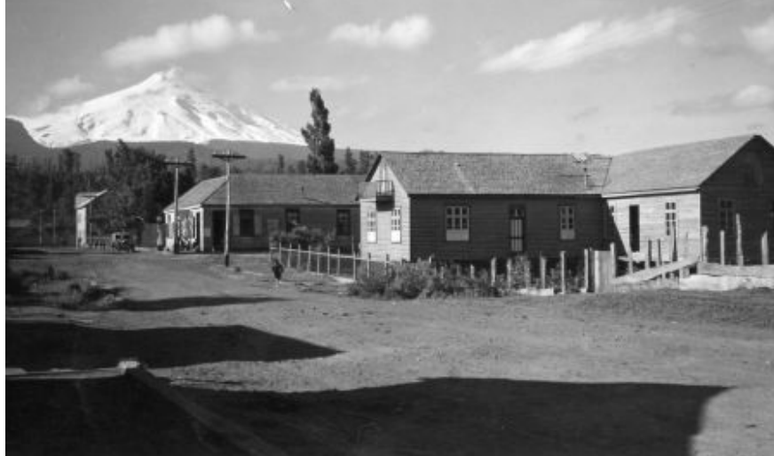
Vista lateral del Colegio Alemán de Pucón