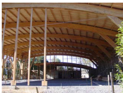
Construcción de techumbre, abril 2003