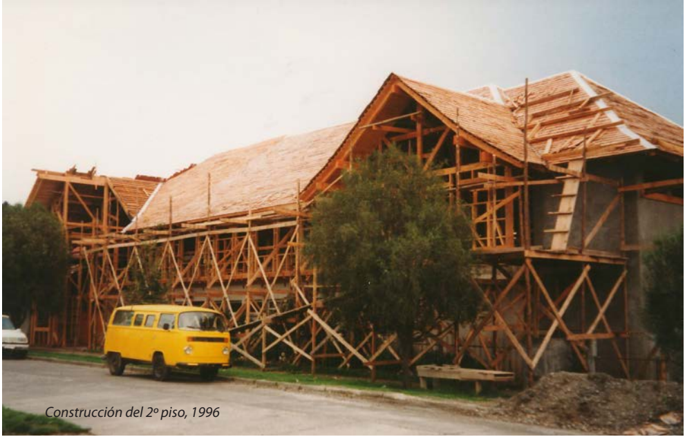
Construcción del 2º piso, 1996

Para el Colegio fue importante en ese año 1996 iniciar los trámites para poder rendir el Sprachdiplom, acontecimiento que elevaría la categoría adquirida por nuestro Colegio en el aspecto pedagógico de los Colegios Alemanes.