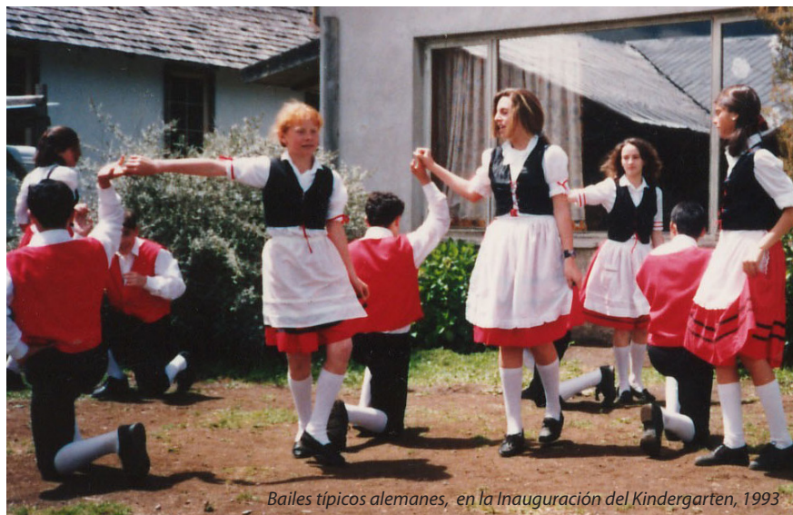
Bailes típicos alemanes, en la Inauguración del Kindergarten, 1993