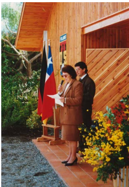
Inauguración Kindergarten, 1993

En el año 1993 se produce un notable incremento del número de matriculados, llegando a 142. Los alumnos egresados de 8º Básico deben continuar estudios en Temuco para completar su ciclo de Enseñanza Media, lo que no siempre es posible, por contar con escasos cupos. El directorio con una mirada visionaria, toma la iniciativa de crear nuestra propia Enseñanza Media.