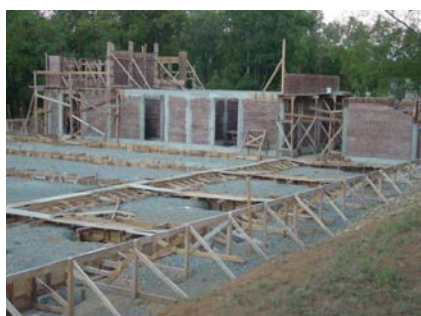
Construcción de cimientos, marzo 2003