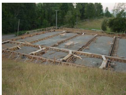
Construcción de cimientos, enero 2003