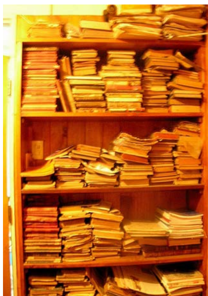
Libros de la biblioteca original (foto actual)