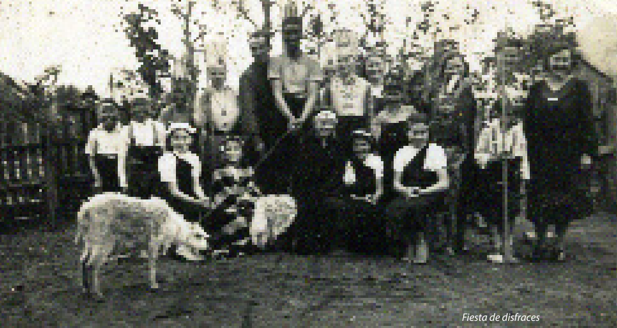
Fiesta de disfraces

confiera el poder al Presidente de la Sociedad Teuto- Chilena de Educación, para que represente a este Colegio ante el Ministro de Instrucción Pública, Autoridades Educativas y Oficinas Públicas en general.