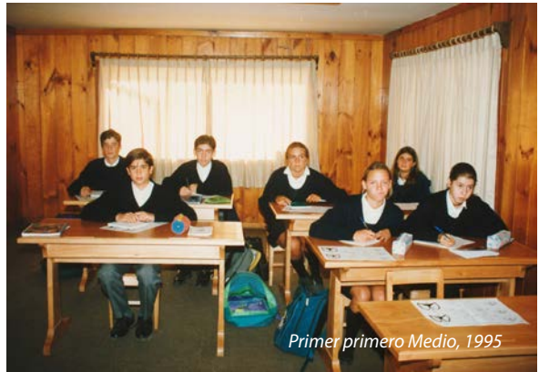
Primer primero Medio, 1995