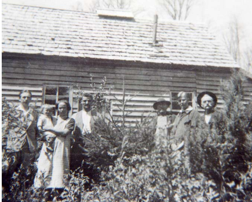
Colonos de Quilaco

miría el cargo de profesor y Director del Establecimiento Educacional.