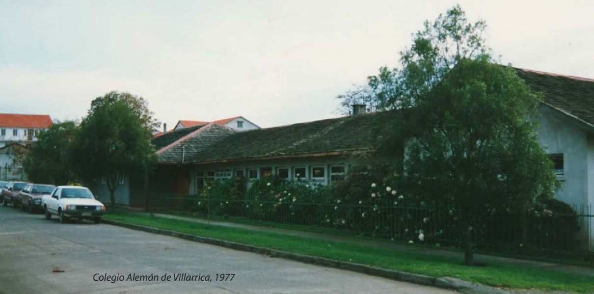
Colegio Alemán de Villarrica, 1977

go un Proyector Over-Head, y ya que en 6º Básico no todos los alumnos tenían posibilidad de trasladarse a Temuco, se comienza a fomentar el proyecto de agrandar el colegio hasta 8º Básico.