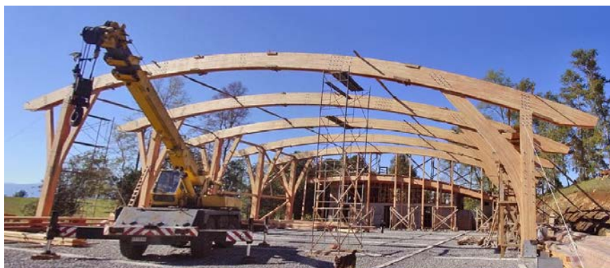
Construcción de estructura, abril 2003