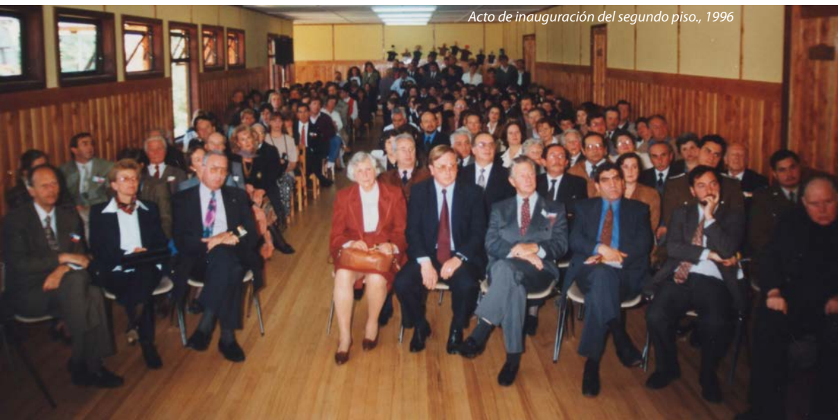
Acto de inauguración del segundo piso., 1996

El Ministerio de Educación en el año 1999 otorga a los Colegio Alemanes de Chile el estatus de “Especial Singularidad” lo que permite tener más libertad en la planificación académica.