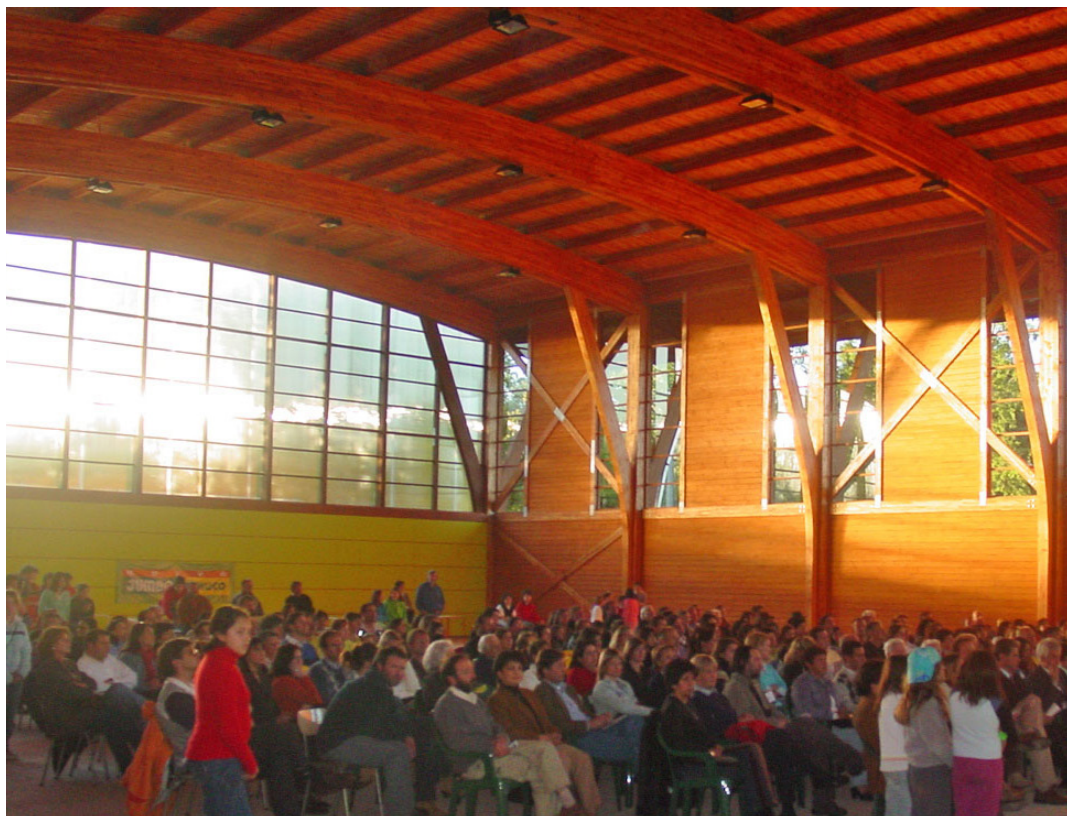
Acto inauguración del gimnasio

H a pasado el tiempo, y como hemos visto en los capítulos anteriores, nuestro Colegio ha crecido en número de alumnos, hecho muy positivo para el plantel, ya que significa que la comunidad está valorando el esfuerzo de los docentes y las gestiones administrativas del Directorio, para entregar una educación de excelencia.